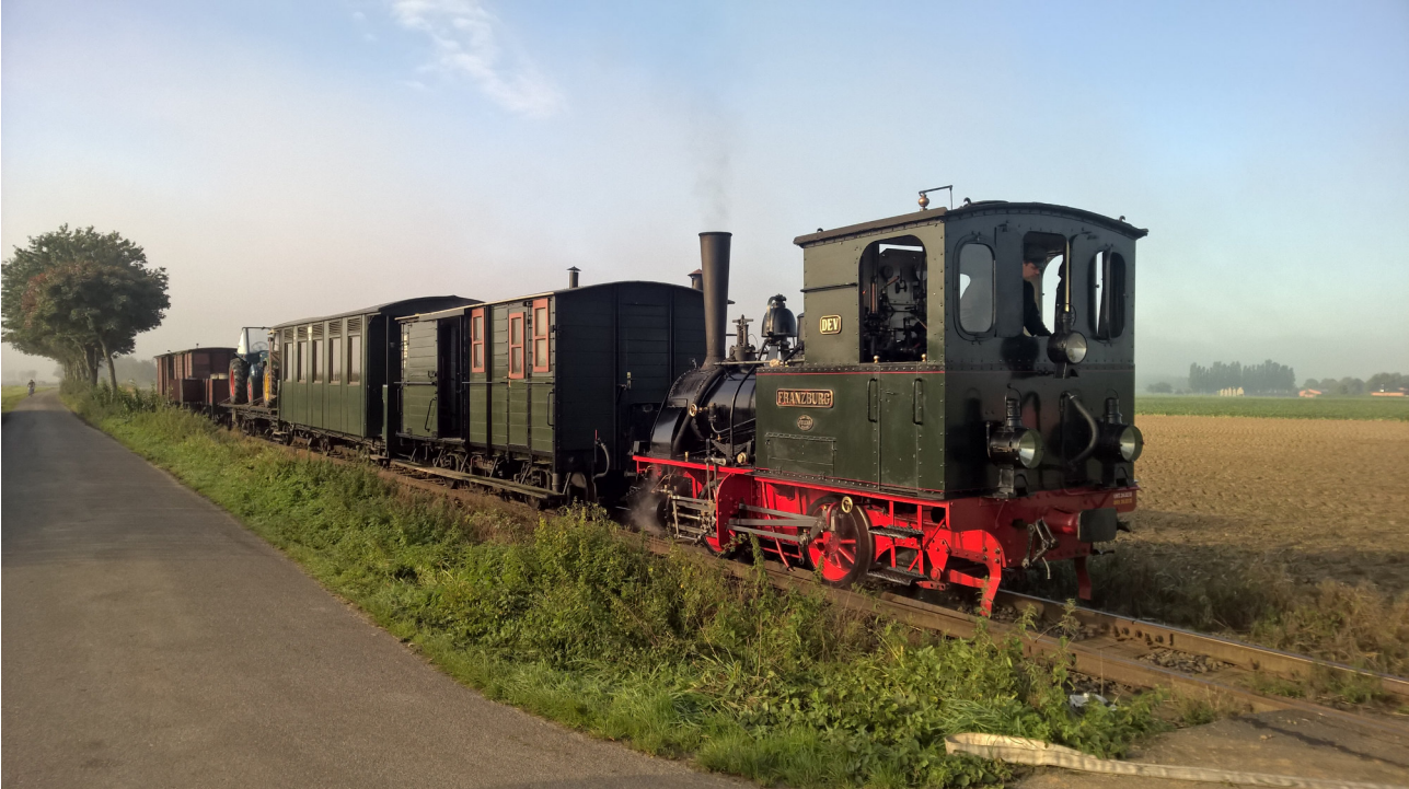
Lok „FRANZBURG“ mit dem morgendlichen 6-Uhr-Sonderzug der Selkantbahn, anlässlich des Erntedankfestes 2015. © Georg Breuer 2015